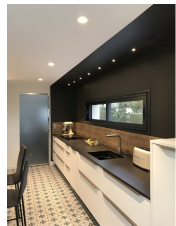
Spots câblés en série : consommation énergétique réduite