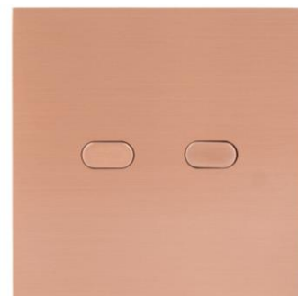
Laiton, finition Cuivre satiné

Fabriquées en France, les créations Meljac résultent de l'alliance de technologies de pointe et de l'irremplaçable main de l'homme. En laiton massif, elles garantissent une esthétique et une durabilité optimale qui font la réputation de la marque.