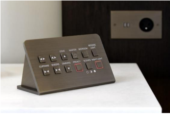
Pupitre MELJAC pour le Mandarin Oriental Paris (système Incom Honeywell)