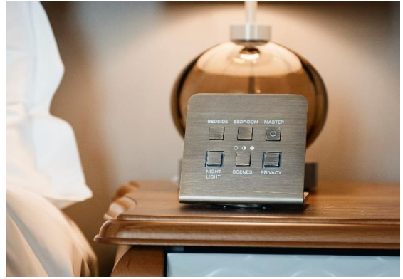
Pupitre MELJAC pour le Mandarin Oriental Munich (système KNX)