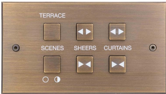
Interrupteur précâblé Collection Damier Meljac