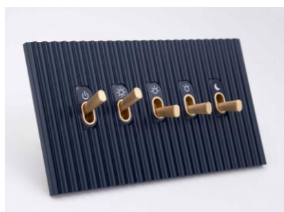
Collection Cannelée Meljac pour le Cheval Blanc St Tropez (Lutron)

L'interrupteur Meljac est raccordé directement au tableau électrique par l'installateur, ou clipsé dans un module fond de boîte dans le boîtier d'encastrement.