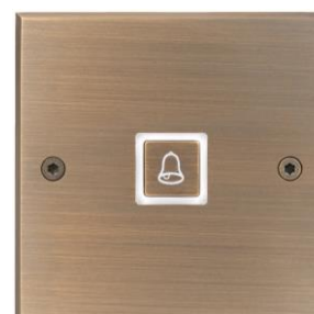
Laiton, finition Bronze Médaille Allemand, rétroéclairage et sérigraphie

Découvrez les secrets du savoir-faire MELJAC en vidéo :