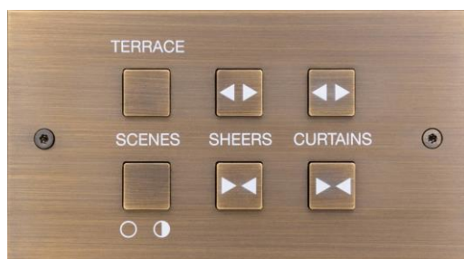
Laiton, finition Bronze Médaille Allemand, résine blanche

Les gravures sur boutons (pictogrammes, mots, symboles...) peuvent rester dans la même finition que la plaque, ou revêtir une résine de couleur pour contraster.