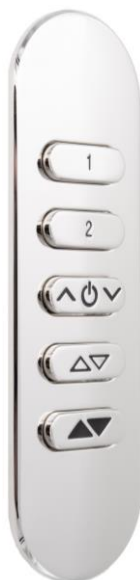
Laiton, finition Chromé vif, résine noire