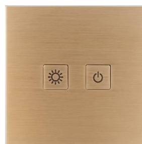
Laiton, finition Bronze Médaille Clair