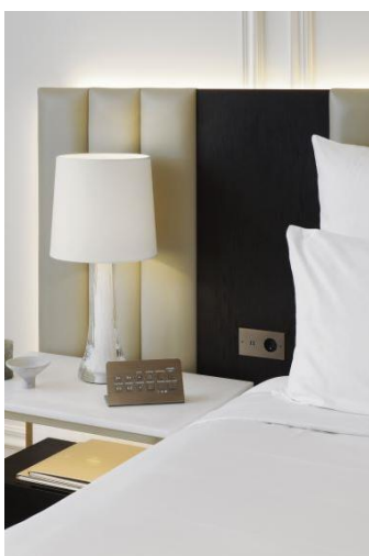
Pupitre de commandes (Mandarin Oriental Paris)

L'espace du stand consacré à la domotique permettra aux visiteurs d'activer quelques exemples de scénarios, à partir de commandes en laiton aux finitions raffinées.