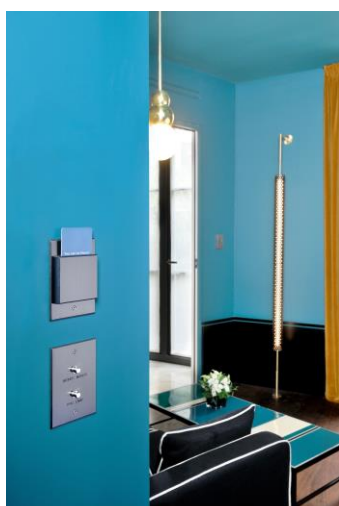
Lecteur de cartes et interrupteur gravé (Roch & Spa Paris)