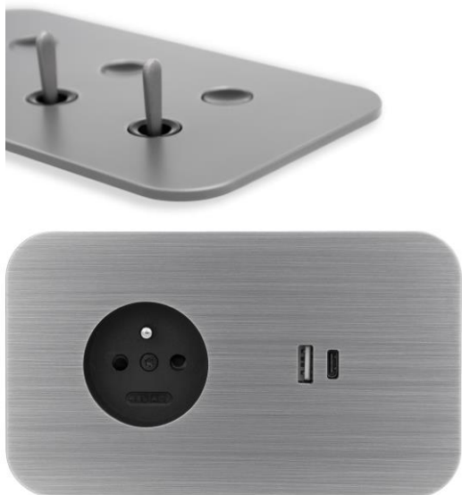
Collection Solaris Voir le communiqué

Les visiteurs découvriront les solutions MELJAC dédiées à l'hôtellerie, les nouveautés et les choix de personnalisation ou de modèles sur-mesure. L'équipe a à cœur d'accompagner chaque client dans ses projets. Ils pourront apprécier la qualité des produits avec des exemples de réalisations faites pour Le Meurice, le Mandarin Oriental ou encore l'hôtel Richer de Belleval. Et, pour ceux qui n'ont pas encore eu l'occasion de les voir, les dernières collections, conçues en collaboration avec le designer Marc NEWSON pour Solaris et avec le joaillier Tournaire pour la collection éponyme, seront exposées parmi les autres gammes et produits phares de la marque, très plébiscitée dans l'hôtellerie.