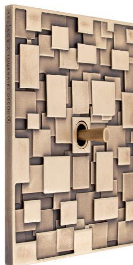
Collection Tournaire Voir le communiqué

Distribution : https://www.meljac.com/contact/