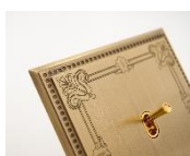
Modèle personnalisé pour projet résidentiel

De nombreuses réalisations sur-mesure et créations personnalisées (35% des produits fabriqués) voient régulièrement le jour dans les ateliers MELJAC, comme le Pupitre créé pour l'hôtel Mandarin Oriental (Paris et Munich) ou encore des plaques gravées spécifiquement pour les projets résidentiels.