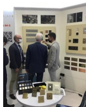
Stand MELJAC Downtown Design Dubaï

En 2021, le CA à l'export a enregistré une croissance de +15% par rapport à 2020. Outre sa présence en Europe, l'entreprise poursuit le développement sur le marché US avec sa filiale implantée à Los Angeles depuis 2018 (7% du CA global soit +56% en 2021) et exploite progressivement le fort potentiel identifié au Moyen Orient.