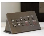
Pupitre pour Mandarin Oriental