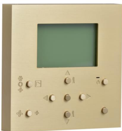
Habillage en laiton massif d'une commande de climatisation

MELJAC s'attache à valoriser le raffinement de chacun de ces matériaux en innovant constamment pour faire de ces objets fonctionnels de véritables pièces d'exception uniques, personnalisables et esthétiques. Certaines réalisations peuvent être faites, sur demande, avec d'autres matériaux tels que du bronze ou même des pierres semi-précieuses.