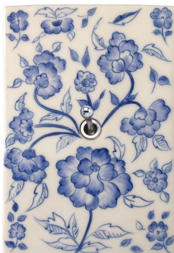
Porcelaine de Limoges émaillée