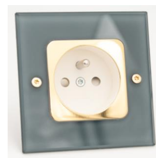
Verre trempé, RAL gris