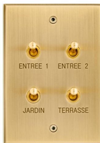
Autre possibilité de réalisation Meljac