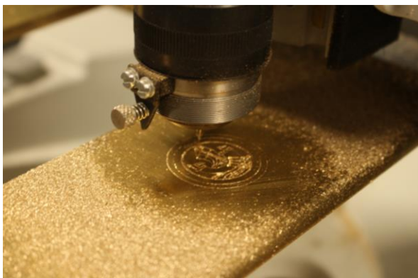
Gravure du logo du Lutetia après usinage du laiton