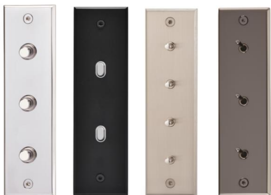
Finition Nickel Brillant 38x133x3 mm

Les formats étroits sont disponibles dans les collections Classique (bords chanfreinés), Ellipse et Damier (bords droits). Ainsi les clients ont le choix des mécanismes : leviers, boutons poussoirs, mini boutons 12V avec ou sans capuchon, et peuvent même s'ils le souhaitent, combiner plusieurs designs.