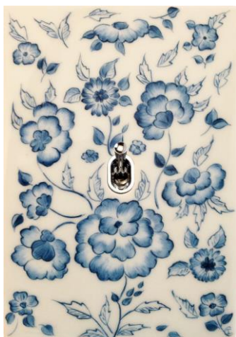
Interrupteur LIMOGES, levier Ellipse

Reconnue pour la finesse de ses modèles combinant esthétique et technique, la marque investit pour renforcer sa capacité de production avec de nouveaux outils. Cela permet aux équipes de mettre davantage leur savoir-faire au profit des réalisations sur-mesure.